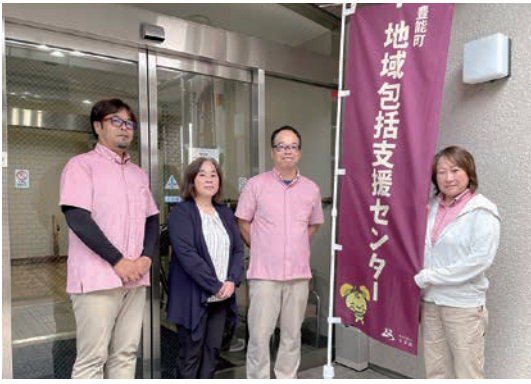
私たちが地域包括支援センターの職員です

介護保険制度が始まって26年。少子高齢化が進む中、福祉のあり方は大きく変わろうとしています。高齢者支援や介護だけにとどまらず、子育て・障がい者支援・地域のつながりづくりなど、分野を越えた「支え合い」がますます重要な時代となりました。