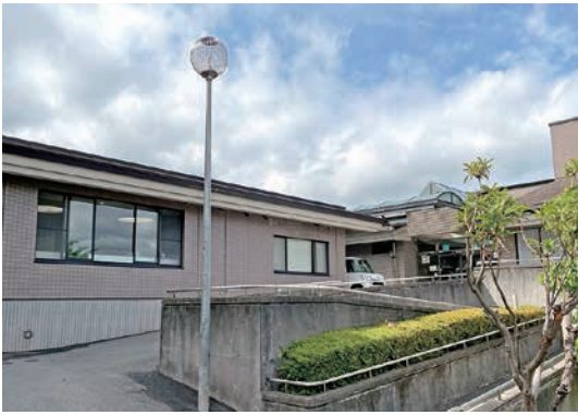
地域包括支援センター 外観

「まち」を基本理念として掲げています。この理念を実現する中心的な役割を担うのが、地域包括支援センターです。このたび、令和8年4月より、祥雲館（豊悠福祉会）がその運営を豊能町から受託いたしました。責務の重さを改めて感じるとともに、地域の皆さまへの思いを新たにしています。